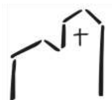
St. Nikolaus Niederhöchstadt