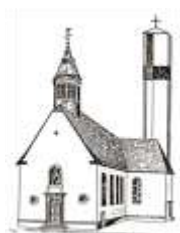
St. Pankratius Schwalbach