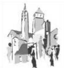
St. Marien und St. Katharina Bad Soden

Pfarreien im Pastoralen Raum Main-Taunus-Ost