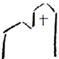
St. Nikolaus Niederhöhnstadt