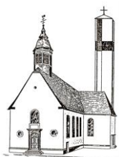
St. Pankratius Schwalbach