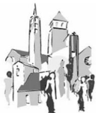
St. Marien und St. Katharina Bad Soden

Pfarreien im Pastoralen Raum Main-Taunus-Ost